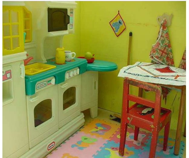
ANGOLO SIMBOLICO ركن رمزي