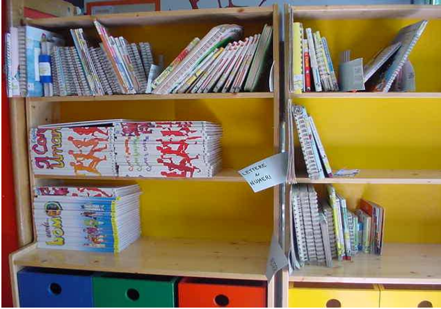
ANGOLO DELLA LETTURA ركن القراءة

Nella scuola per l'infanzia ci sono tanti angoli قلوف ظل اقس ردم يف نكر آل انم دي دع كنه